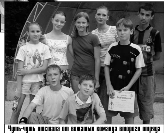
Чуть-чуть отстала от вожатых команда второго отряда