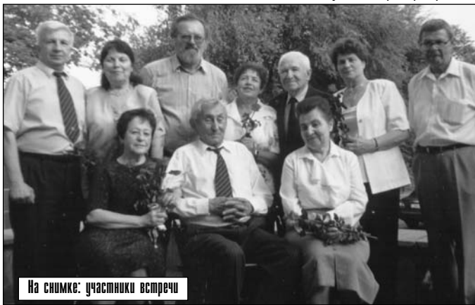
На снимке: участники встречи