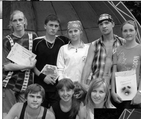
Команда вожатых – победитель военизированной эстафеты