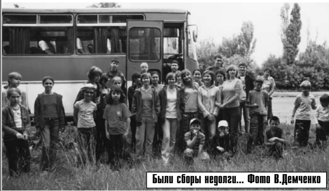
Были сборы негодки...

Профком намерен проанкетировать всех отдохнувших и подготовку к лету-2006 провести с учетом их пожеланий и средств, которые будут на отды выделены.