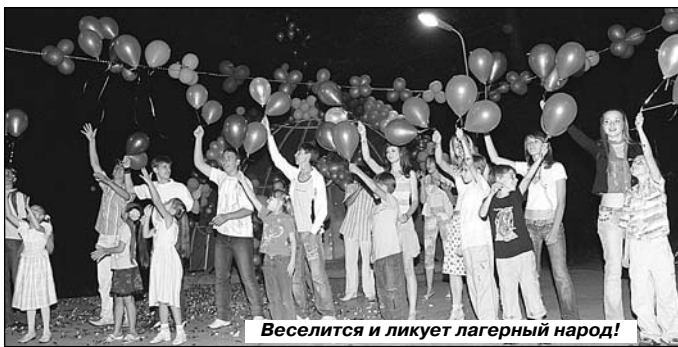
Веселится и ликует лагерный народ!